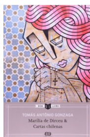
Título: MARILIA DE DIRCEU & CARTAS CHILENAS Autor(a): Tomás Antônio Gonzaga Editora: Ática