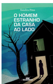
Título: O HOMEM ESTRANHO DA CASA AO LADO Autor(a): Sandra Pina Editora: Melhoramentos